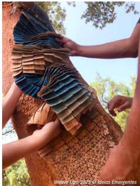
Weave Up! , 2023

L'exposition Weave Up! retrace le parcours de 24 jeunes designers en Europe, à la rencontre du lin, de la laine, du liège textile et du cuir alternatif, en France, en Lituanie et au Portugal. Pour tout apprendre sur leur production et leur transformation, afin d'imaginer comment ces matières écologiques pourront être utilisées dans un futur proche.