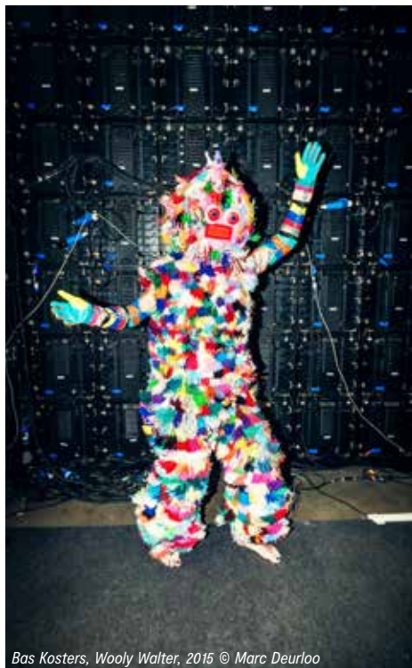
Bas Kusters, Woolly Walter, 2015