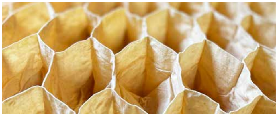
Marija Žiemytė, Creation, 2022 © Marija Žiemytė