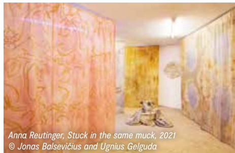
Anna Reutinger, Stuck in the same muck , 2021 © Jonas Balsevičius and Ugnius Gelguda

Jardin Voyou est une installation dans laquelle un groupe d'acteurs non humains, dans un jardin très bien entretenu, planifie une révolte contre le jardinier, révélant une réflexion sur la façon dont les textiles ont façonné les interactions humaines et notre rapport au monde.