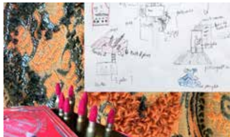
Camille Raad, Paul, 2024

Individuelles ou polyphoniques, les œuvres présentées par les étudiantes et étudiants costumiers de l'École nationale supérieure des arts et techniques du théâtre de Lyon (ENSATT) interrogent de façon sensible et transversale les modes de création qui sont les leurs, n'hésitant pas à tordre le cou aux constats d'un monde que leurs recherches personnelles, théâtrales ou plastiques, leur font sans cesse réinventer. En présence des étudiants de l'ENSATT. Venez partager un temps de broderie (matériel non fourni) avec eux !