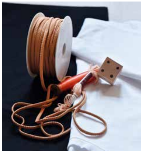
Collectif FU, Game Over, Let's Play, 2024

Gratuit pour les moins de 12 ans. (04 77 24 98 71)